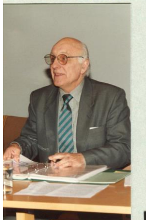
A. Kyrkjebø Deprivasjonsloven